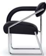
Leder schwarz leather black