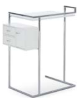
PETITE COIFFEUSE 1929