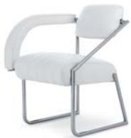
Leder weiß leather white

Estructura de tubos de acero cromado. Asiento de marco en madera de haya con bandas de goma. Acolchado: poliuretano con espuma. Tapicería de cuero. Detalles y colores ver lista de precios.