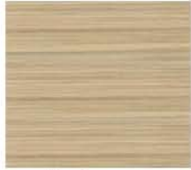
rovere sbiancato blanched oak