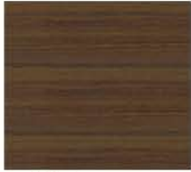
noce Vinterio Vinterio walnut classic