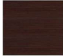
rovere noce scuro oak dark walnut