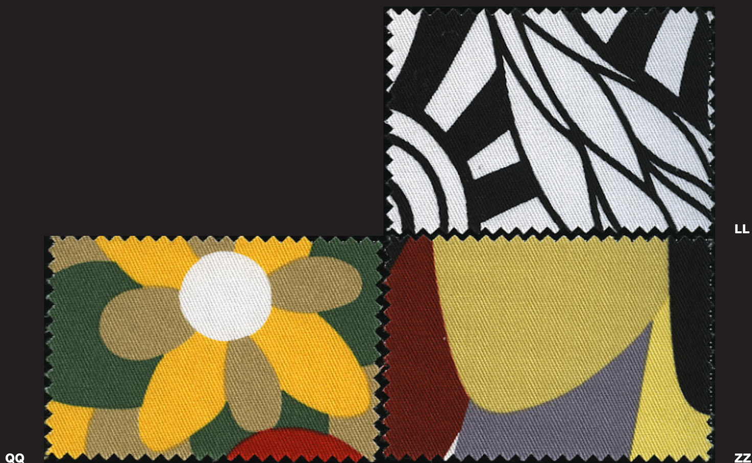
LL CARTAGENA B/N QQ VEVEY TONI ROSSI / VEVEY RED TONES TONS ROUGES / VEVEY TONOS ROJOS ZZ VEVEY TONI BRUCIATI / VEVEY BURNT TONES / TONS TERRE CUITE VEVEY TONOS QUEMADOS