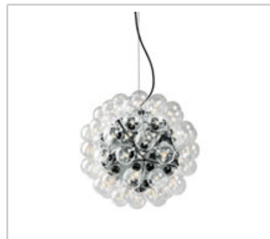
Taraxacum 88 S1 design by Achille Castiglioni

Hangeleuchte fur direktes und reflektiertes Licht.