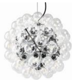
Taraxacum 88 S2 design by Achille Castiglioni

Hängeleuchte für direktes und reflektiertes Licht.