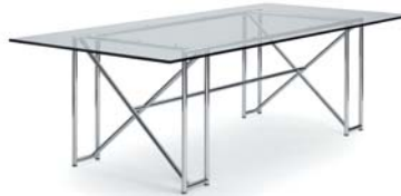
Kristallglass crystal glass