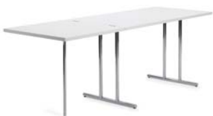
LOU PEROU 1932