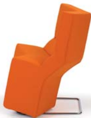
Divina orange orange