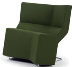
Europost grün green

Mueble acolchado. Estructura de tubos de acero con bandas de goma y poliuretano rígido. Acolchado de poliuretano con poliéster. Armazón de acero inoxidable. Tapicería de tela o de cuero. Detalles y colores ver lista de precios.