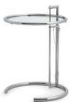
ADJUSTABLE TABLE E 1027 1927