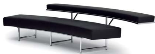
MONTE CARLO 1929