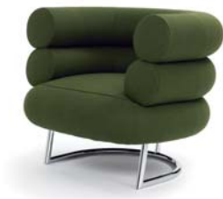
Europost grün green