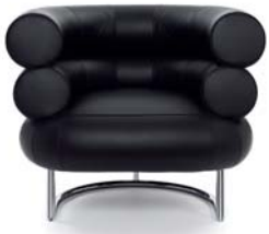
Leder schwarz leather black

Estructura de tubos de acero cromado. Asiento de marco en madera de haya con bandas de goma. Acolchado: poliuretano con espuma de poliéster. Tapicería de tela o cuero. Detalles y colores ver lista de precios.