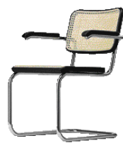
S 64 V

Anniversary offer: When buying an anniversary edition a chair classic from the Bauhaus era is added free of charge: models S 64 V, S 33 N or S 43 (valid through 12/31/2010).