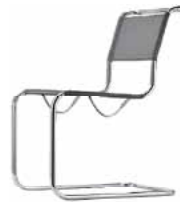
S 33 N