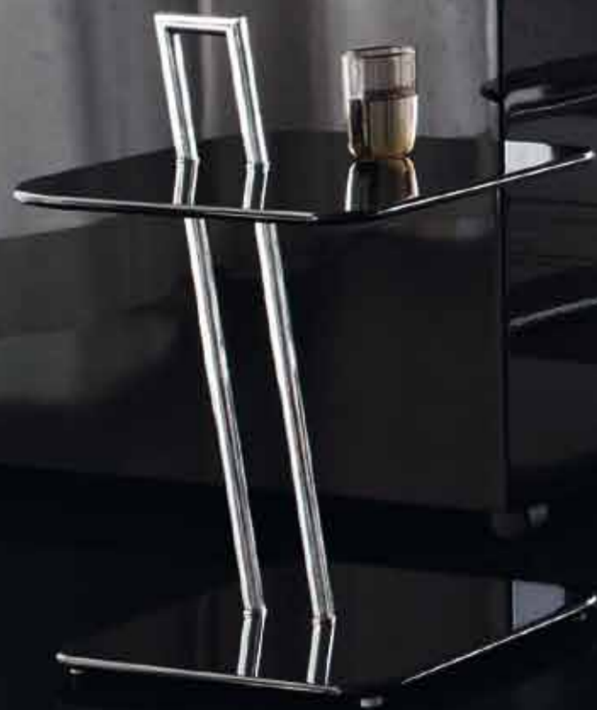
OCCASIONAL TABLE 1927