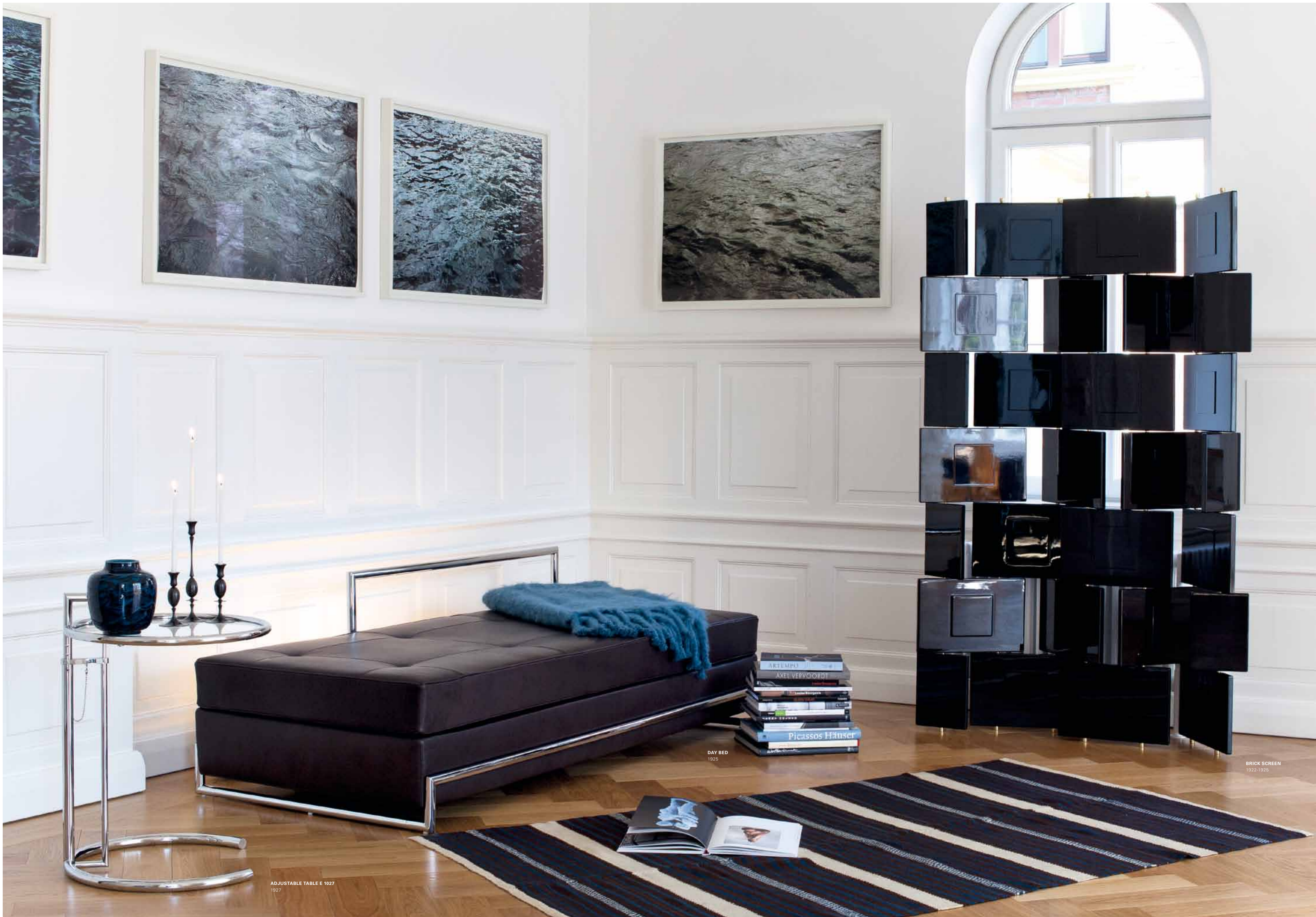
ADJUSTABLE TABLE E 1027 1927