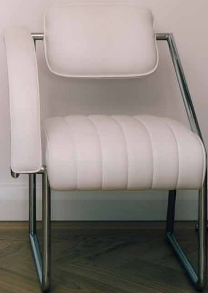
NON CONFORMIST 1926