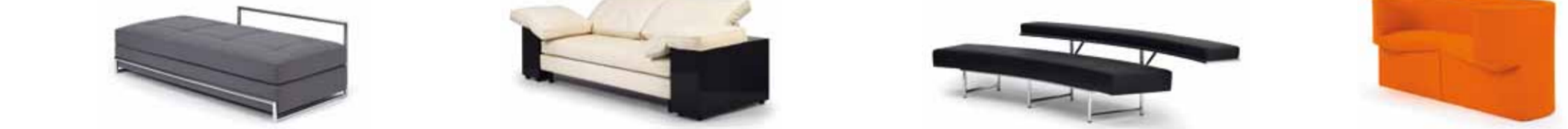
DAY BED 1925 EILEEN GRAY H 60 / B 190 / T 86 / SH 41 LOTA 1924 EILEEN GRAY H 85 / B 240 / T 875 / SH 43 / BOX H 55 / B 30 MONTE CARLO 1929 EILEEN GRAY H 60 / B 280 / T 95 / SH 40 ODIN 2005 KONSTANTIN GRICIC H 74 / B 160 / T 69 / SH 44