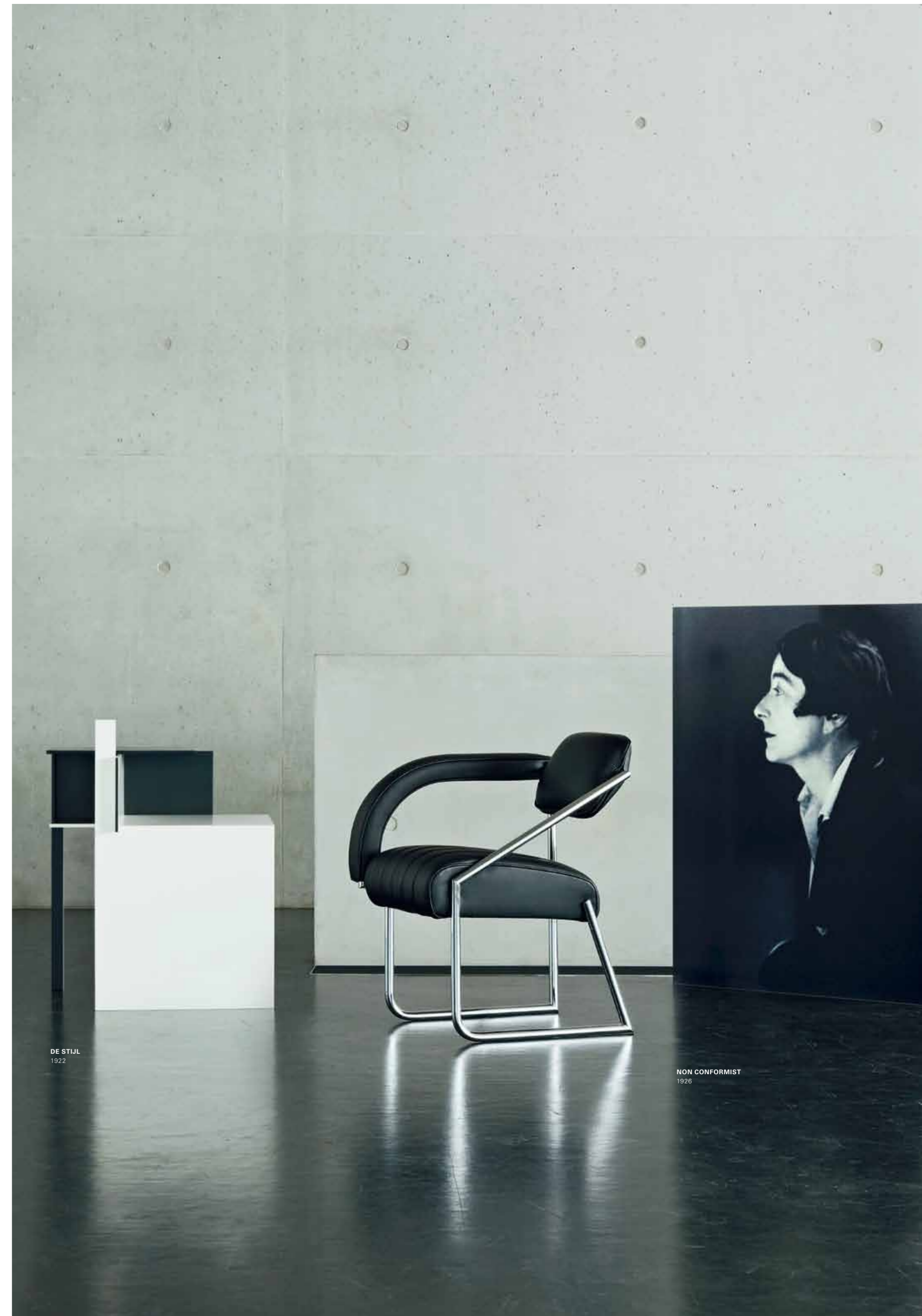
DE STIJL 1922