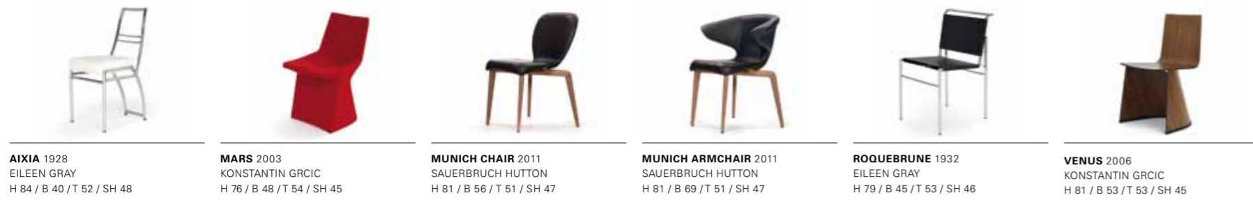
AIXIA 1928 EILEEN GRAY H 84 / B 40 / T 52 / SH 48 MARS 2003 KONSTANTIN GRICIC H 76 / B 48 / T 54 / SH 45 MUNICH CHAIR 2011 SAUERBRUCH HUTTON H 81 / B 56 / T 51 / SH 47 MUNICH ARMCHAIR 2011 SAUERBRUCH HUTTON H 81 / B 69 / T 51 / SH 47 ROQUEBRUNE 1932 EILEEN GRAY H 79 / B 45 / T 53 / SH 46 VENUS 2006 KONSTANTIN GRICIC H 81 / B 53 / T 53 / SH 45