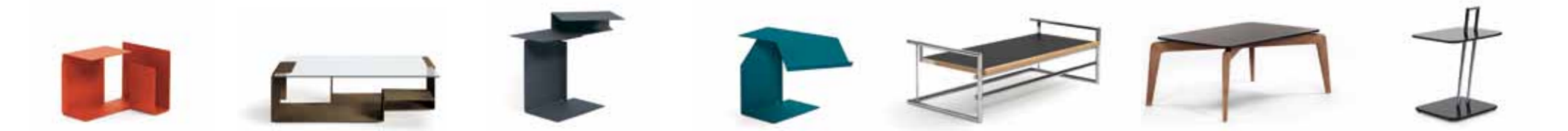
DIANA C 2002 KONSTANTIN GRICIC H 34 / B 47 / T 36 DIANA D 2002 KONSTANTIN GRICIC H 27 / B 90 / T 64 DIANA E 2002 KONSTANTIN GRICIC H 54 / B 61 / T 47 DIANA F 2002 KONSTANTIN GRICIC H 44 / B 41 / T 65 MENTON 1932 EILEEN GRAY H 42/85 / TH 32/85 / B 126 / T 56/65 MUNICH COFFEE TABLE 2010 SAUERBRUCH HUTTON H 38 / B 88 / T 58 OCCASIONAL TABLE 1927 EILEEN GRAY H 57 / TH 43 / B 36 / T 40