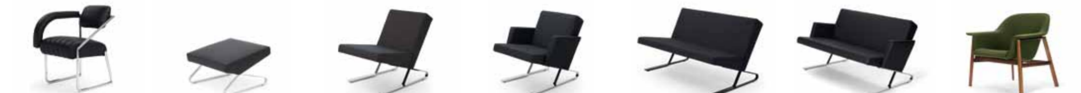
NON CONFORMIST 1926 EILEEN GRAY H 78 / B 57 / T 63 / SH 45 SATYR 2008 FOR USE H 45 / B 63 / T 64 SATYR 2006 FOR USE H 74 / B 63 / T 80 / SH 42 SATYR ARMREST 2008 FOR USE H 74 / B 76 / T 80 / SH 42 SATYR II 2007 FOR USE H 74 / B 135 / T 79 / SH 42 SATYR II ARMREST 2008 FOR USE H 74 / B 147 / T 79 / SH 42 SEDAN LOUNGER 2013 NERI&HU H 74 / B 85 / T 65 / SH 38/42