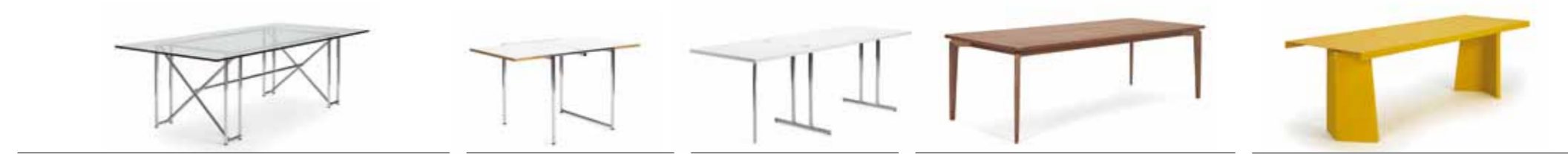
DOUBLE X 1928 EILEEN GRAY H 71/73 / B 224/230 / T 82/110 JEAN 1929 EILEEN GRAY H 70/72 / B 65/130 / T 70 LOU PEROU 1932 EILEEN GRAY H 70 / B 130/195 / T 65 MUNICH TABLE 2011 SAUERBRUCH HUTTON H 74 / B 180/210/240 / T 90/90/100 PALLAS 2003 KONSTANTIN GRICIC H 72 / B 240/300 / T 76