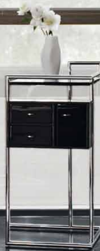
PETITE COIFFEUSE 1929