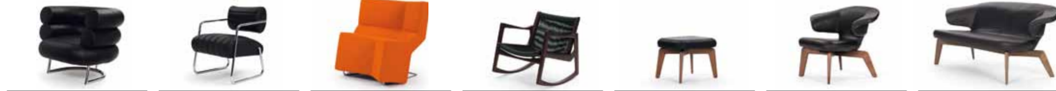
BIBENDUM 1929 EILEEN GRAY H 72 / B 90 / T 81 / SH 41 BONAPARTE 1935 EILEEN GRAY H 75 / B 61 / T 67 / SH 46 CHAOS 2001 KONSTANTIN GRICIC H 78 / B 90 / T 66 / SH 42 EUVIRA 2013 JADER ALMEIDA H 69/74 / B 72 / T 75 / SH 36/45 MUNICH STOOL 2012 SAUERBRUCH HUTTON H 42 / B 53 / T 42 MUNICH LOUNGE CHAIR 2009 SAUERBRUCH HUTTON H 72 / B 97 / T 69 / SH 41 MUNICH SOFA 2010 SAUERBRUCH HUTTON H 76 / B 163 / T 77 / SH 42