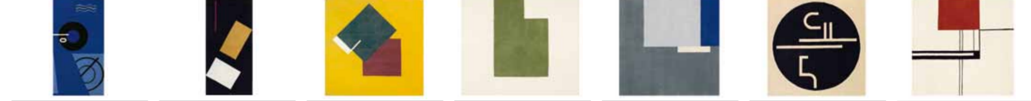
BLUE MARINE 1926-1935 EILEEN GRAY L 215 / B 110 BONAPARTE 1926-1935 EILEEN GRAY L 210 / B 100 CASTELLAR 1926-1935 EILEEN GRAY L 175 / B 175 KILKENNY 1926-1935 EILEEN GRAY L 235 / B 201 ROQUEBRUNE 1926-1935 EILEEN GRAY L 200 / B 200 ST. TROPEZ 1926-1935 EILEEN GRAY L 204 / B 204 WENDINGEN 1926-1935 EILEEN GRAY L 208 / B 200