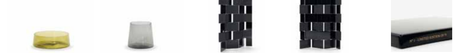
BOWL H 10 / D 32 VASE H 20 / D 22 BRICK SCREEN 1922-1925 EILEEN GRAY H 187 / B 115 / T 24