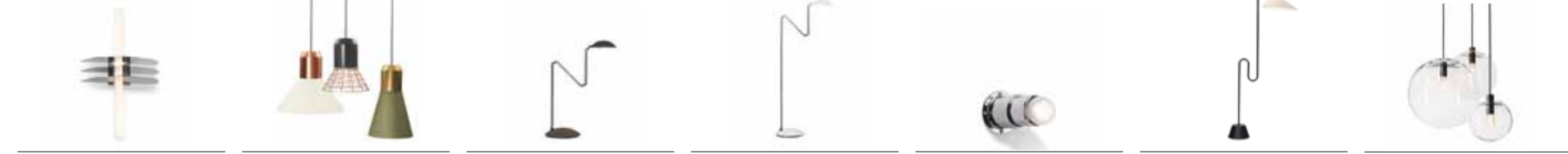
ARES 1992 STEPHAN BRAUNFELS H 50 / B 30 / T 20.5 BELL LIGHT 2013 SEBASTIAN HERKNER H 34-53 / D 29-45 / CORD LENGTH 200 ORBIS (TL) 1994 HERBERT H. SCHULTES H 51-101 / B MAX 71 / D 27 ORBIS (FL) 1994 HERBERT H. SCHULTES H 103-151 / D 26 PAILLA 1932 EILEEN GRAY T 12 / D 8 ROATTINO 1931 EILEEN GRAY H 150 / D 21 SELENE 2006 SANDRA LINDNER D 20/25/30/35/45 / CORD LENGTH 200