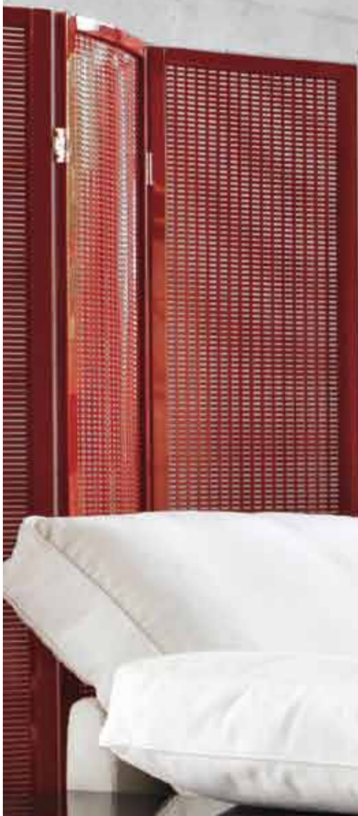
FOLDING SCREEN 1930