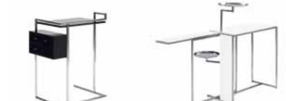
PETITE COIFFEUSE 1929 EILEEN GRAY H 84 / TH 76 / B 64 / T 47 RIVOLI 1928 EILEEN GRAY H 101 / TH 71 / B 73/139 / T 36/64