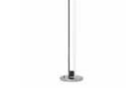
TUBE LIGHT 1927 EILEEN GRAY H 103 / D 25