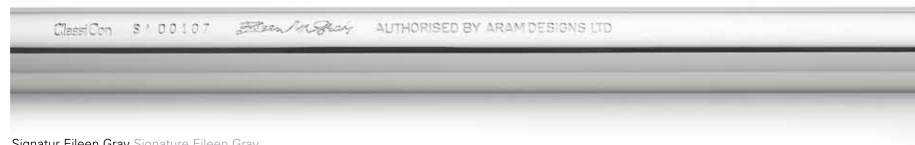
Signatur Eileen Gray Signature Eileen Gray

“Our modern classics are collector’s items – not only the masterpieces of yesterday, but of tomorrow as well. We aim above all to produce individual pieces of great originality and formal perfection – pieces with the potential to become classics in their own right one day. Displaying the kind of value that lasts, these pieces are destined to become coveted investments for future generations.“