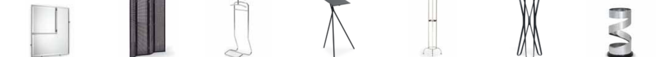
CASTELLAR 1927 EILEEN GRAY H 63 / B 56 (H 34 / B 35) FOLDING SCREEN 1930 EILEEN GRAY H 167 / B 10-143 MANDU 1932 ECKART MUTHESIUS H 109 / B 41 / T 38 NOTOS 1997 THOMAS KÜHL + ANDREAS KROB H 115-135 / B 75 / T 63 (B 62 / T 49) NYMPHENBURG 1908 OTTO BLÜMEL H 180 / T 49 SATURN 2007 E. BARBER + J. OSGERBY H 165 / B 59 / T 53 USHA 1932 ECKART MUTHESIUS H 50 / D 28