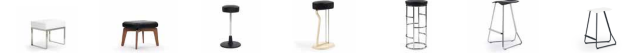
BANU 1931 ECKART MUTHESIUS H 46 / B 52 / T 42 MUNICH STOOL 2012 SAUERBRUCH HUTTON H 42 / B 53 / T 42 BAR STOOL NO. 1 1927 EILEEN GRAY H 70-80 / D 38 BAR STOOL NO. 2 1928 EILEEN GRAY H 74 / B 30 / T 39 SATISH 1931 ECKART MUTHESIUS H 75 / D 35 TRITON 2007 CLEMENS WEISSHAAR H 74 / B 50 / T 49 TRITON COUNTER 2007 CLEMENS WEISSHAAR H 64 / B 50 / T 49