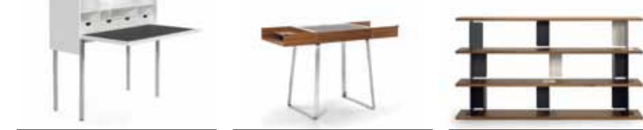
ORCUS 1993 KONSTANTIN GRICIC H 123/125 / TH 73 / B 105 / T 42/92 ZELOS 2008 CHRISTOPH BÖNINGER H 86 / TH 75 / B 60-120 / T 54 PARIS 2005 E. BARBER + J. OSGERBY H 75/112 / B 200 / T 35